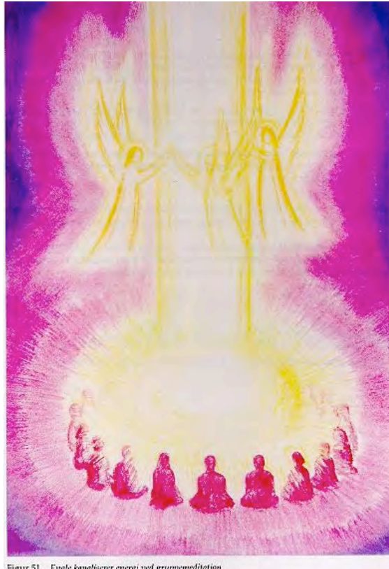
Figur 51. Enote kanalisere energi ved gruppe meditation.